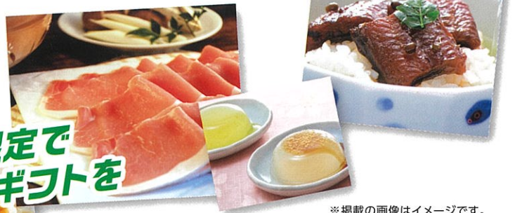
※掲載の画像はイメージです。

ネオレストをご購入の方 先着順 1,010台限定 で 関西の選べるご当地ギョトを プレゼント!